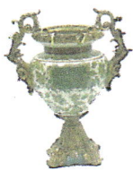
III miejsce w konkursie na najlepszy ogród działkowy w 2008 roku