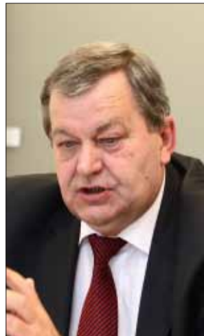
Romuald Kazimierz Ajchler , poseł, Sojusz Lewicy Demokratycznej

terenu, na którym się gospodarzą, a ustawa reguluje ich prawa i obowiązki. Dlatego wyłączenie któregoś z przepisów stworzy problemy. Wyłączonych artykułów nie zastąpią bowiem inne ustawy. Nie wyobrażam sobie również, że może zostać wyłączone działanie całej ustawy. Ludzie, którzy teraz inwestują swój czas i pieniądze, gospodarując na działkach, w pewnym momencie mogą stracić wszystko, co do tej pory osiągnęli. Przecież to ustawa zapewnia, że takiej osobie należy się zwrot poniesionych nakładów za nasadzenia, wybudowane altany, uzbrojenie terenu. Gdy zostanie z ustawy wyłączony ten przepis, to wówczas wyrządzona zostanie wielka krzywda. Kto tym ludziom zagwarantuje i zabezpieczy poszanowanie ich praw?