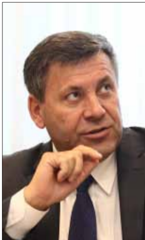
Janusz Piechociński , poseł, Polskie Stronnictwo Ludowe