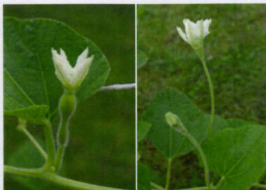
fot. 2 kwiat żeński i kwiat męski

W momencie, kiedy poszczególne owoce osiągną wielkość około 10-15cm mamy pewność, iż zostały one zapylone. Jeżeli chcemy uzyskać prawdziwe tykwowe kolosy, to powinniśmy wybrać 3-4 najdorodniejsze, a resztę odciąć. Sprawi to, iż owoce będą rosły niemal że „w oczach”. W połowie sierpnia odcinamy wszystkie owocujące pędy za drugim liściem za ostatnim owocem, który zostawiamy oraz wycinamy wszystkie nieowocujące pędy.