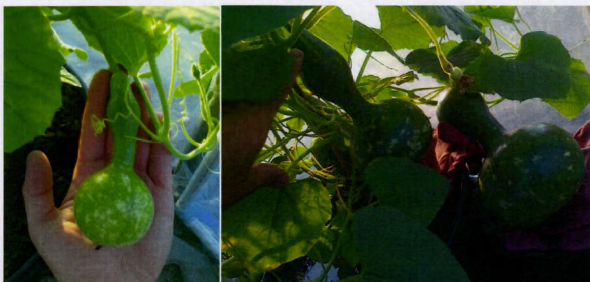
fot. 3 zapylone owoce (lipiec)

Owoce są gotowe do zbioru w początkach października, stają się wówczas lżejsze i bardzo twarde a szypułka jest zdrewniała niekiedy przy dużym nasłonecznieniu skórka staje się żółtawa lub brązowa. Zebrane „plony” należy umieścić w suchym miejscu na 3-4 miesiące by ostatecznie zdrewniały. Po tym okresie nasza budka lęgowa jest już w zasadzie gotowa. Należy tylko wywiercić odpowiednie otwory do wejścia dla ptaków i wybrać ze środka nasiona oraz wysuszony miąższ. Poza otworem głównym (wejściowym) w „podłodze” można również wywiercić otwory odprowadzające ewentualną wodę opadową.